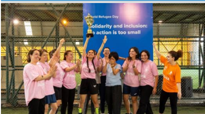
Bakıda inklüziv idman tədbiri @BMT QAK Azərbaycan

3263 məcburi köçkün və digər həssas qrupdan olanlar 2024-cü ilin may-iyun aylarında Yaponiyanın "Fuji Optical" şirkəti tərəfindən göz müayinəsindən keçərək ödənişsiz eynəklərlə təmin olunub.