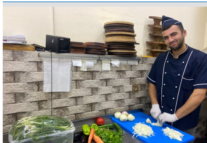
Aşbazlıq sənətinin öyrənilməsi

2852 məcburi köçkün və həssas qrupdan olan şəxs Yaponiyanın "Fuji Optical" şirkətinin göz müayinəsi və eynək paylaşından faydalanıb.