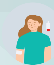
Yorğunluq və halsızlıq