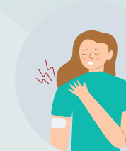
Əzələ və ya oynaq ağrıları