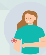
Peyvəndin vurulduğu yerdə ağrı və qol ağrısı

Digər peyvəndlərdə olduğu kimi COVID-19 peyvəndlərinin də yan təsirləri ola bilər. Bu, normaldır və narahatlığa səbəb olmamalıdır. Yan təsirlər əksər hallarda yüngül və ya orta dərəcəli olur və bir neçə gün ərzində öz-özünə keçib, gedir. COVID-19 peyvəndindən sonra ən çox rast gəlinən yan təsirlər aşağıdakılardır: